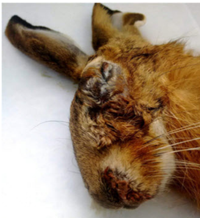
Blefarokonjuntivitis y epistaxis.

La mixomatosis no tiene un tratamiento específico, luego no podemos administrar un fármaco para combatir al virus directamente y mucho menos antibióticos, que no son eficaces frente a ningún virus. Se ha comprobado en liebres enfermas cautivas que si se les proporciona cobijo, agua y alimentación pueden recuperarse, un extremo que no conocemos en liebres silvestres, aunque como ocurre en conejo de monte en estado silvestre, es posible que algunos individuos puedan llegar a recuperarse.