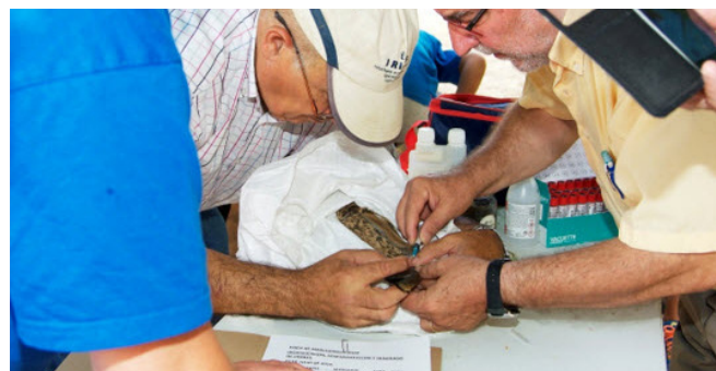
Toma de muestras en liebre

La vacuna no es la única solución. Es importante que todos los implicados en la gestión y caza de la liebre sean conscientes de este hecho, ya que no es factible vacunar a un porcentaje de la población elevada (idealmente > 80%) como para proporcionar una adecuada inmunidad poblacional que permita lograr un control efectivo de la enfermedad.