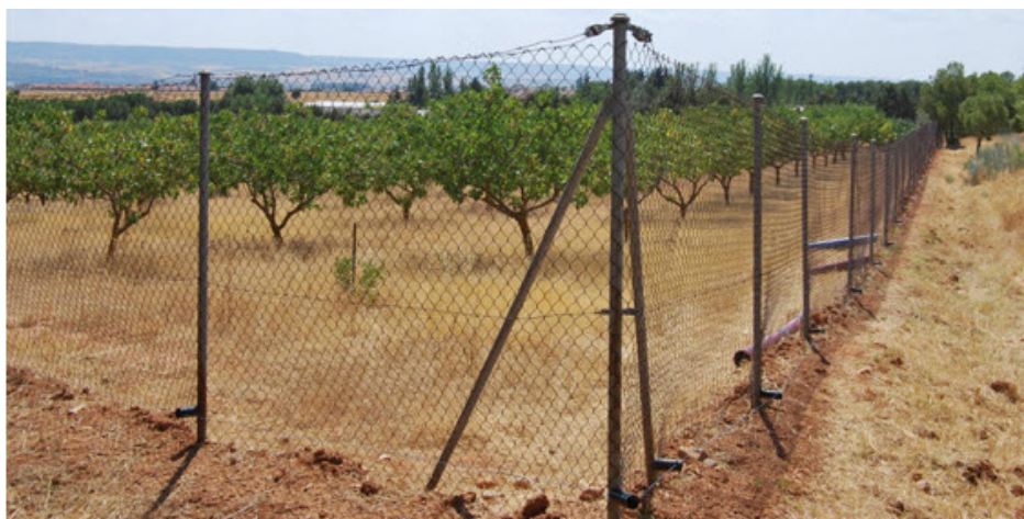
Zona de cría de liebres en semi-libertad

Es necesario realizar más investigaciones para conocer el rendimiento y supervivencia de las liebres criadas en estas condiciones y armonizar la legislación sobre la cría y el movimiento de liebres, especialmente en lo que a control sanitario se refiere.