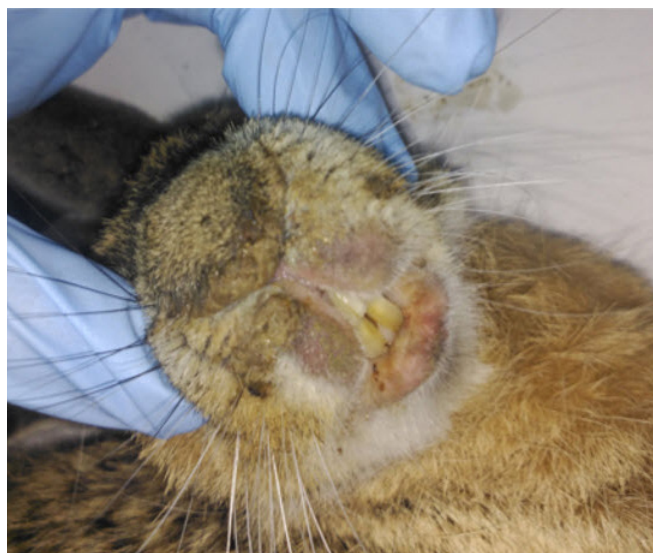
Presencia de edema oronasal.

una especie silvestre una importante proporción de liebres podría morir no por la enfermedad en sí, sino por no poder alimentarse debido a la pérdida de visión consecuencia de la blefaroconjuntivitis, siendo además animales mucho más susceptibles de ser depredadas.